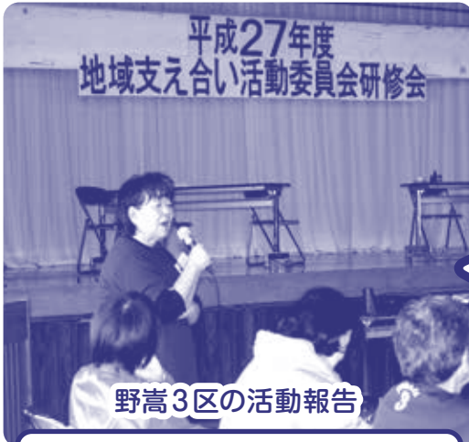
野嵩3区の活動報告

平成28年2月25日(木)に宜野湾市社会福祉センターにて「平成27年度地域支え合い活動研修会」を開催しました。現在、各地域で見守り活動が実践されている中、多くの関係機関や団体が協力し支え合って行ける体制づくりを目的に実施いたしました。当日は、地域支え合い活動委員、自治会長、民生委員や市内福祉事業所、企業からの参加もあり活発な意見交換が行われました。