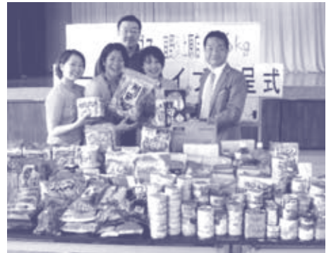
カーブス宜野湾上.原店様から寄付(約360点)

その食糧は、市民の皆様や団体・企業などからの寄付によりおこなっております。宜野湾市社会福祉協議会では、105件の支援をさせて頂きました。昨年度、市民の皆様から約2,520点ものフードドライブへの食糧寄付があり、市民の皆様の取組みは本会にとって大変嬉しいものであります。ご協力、誠にありがとうございました。