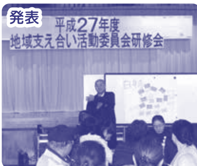
発表 平成27年度 地域支え合い活動委員会研修会