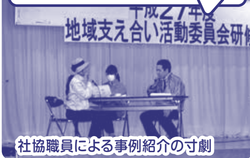
社協職員による事例紹介の寸劇

今回の研修会では、地域の方からの情報提供により生活課題が浮き彫りになった、「一人暮らしの男性高齢者世帯」についてをテーマ設定し、この方が地域で安心して暮らしていく為には、どのような支援が必要なのかを話し合いました。参加者の中からは地域、団体、企業、行政が情報を共有することで、横のつながりを認識できたのはとてもよかった。また、それぞれの立場からの意見が聞けた事で今後の活動の参考になった等の意見がありました(*^_^*)